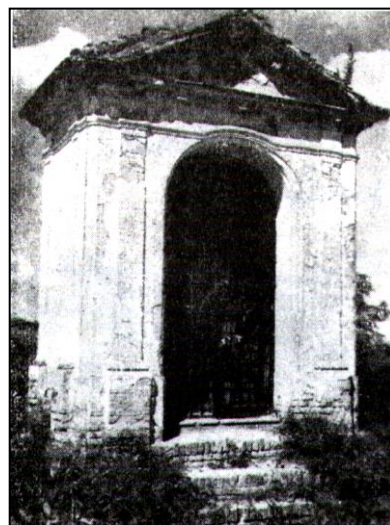
Styrum kápolna a II. világháború előtt. 1