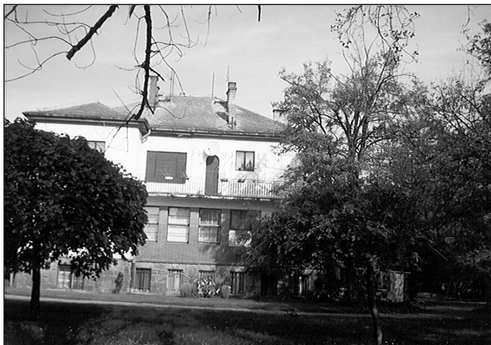
Villa 2. az ezredfordulón. 8