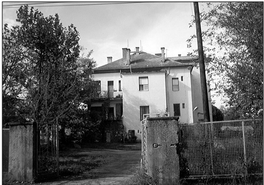
A villáról készült kép az ezredfordulón. A kapuk is még az eredetiek, de nagyon megrongálódott állapotban. 6