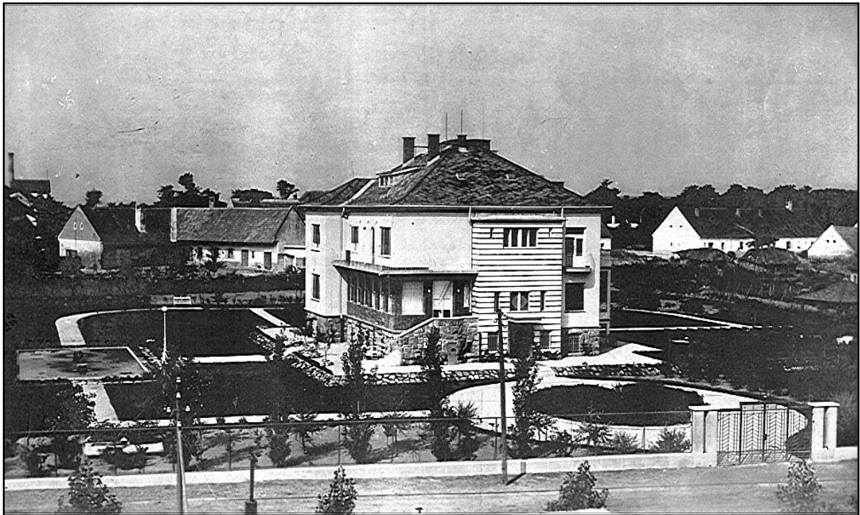
1930-ra Vágó Pál építész tervei alapján megépült Fried Pál és családja lakóháza, a Villa 2. az Arany János utcában - ma több család otthona 5