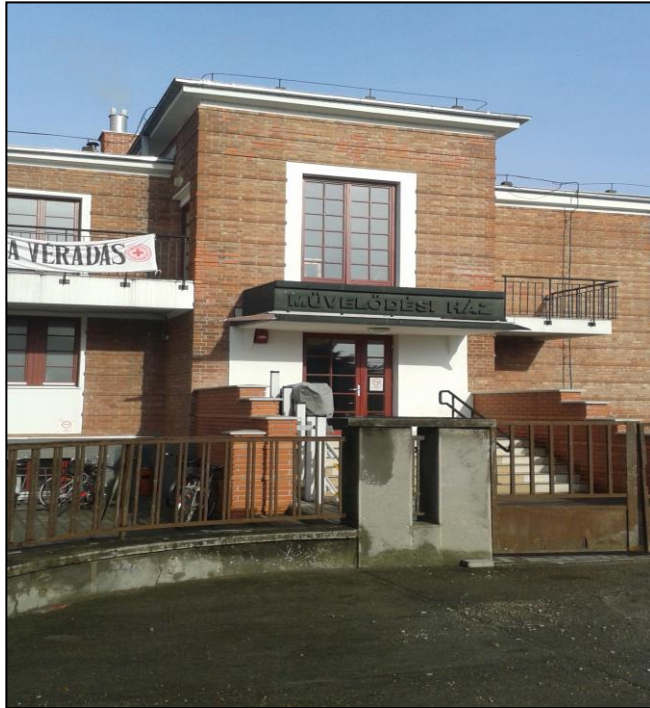
A Fried Művelődési Ház napjainkban.