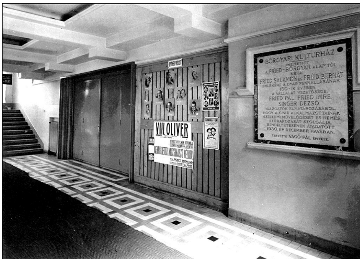
A kultúrház bejárati folyosója, falán az alapítókat méltató emléktábla az 1930-as években.