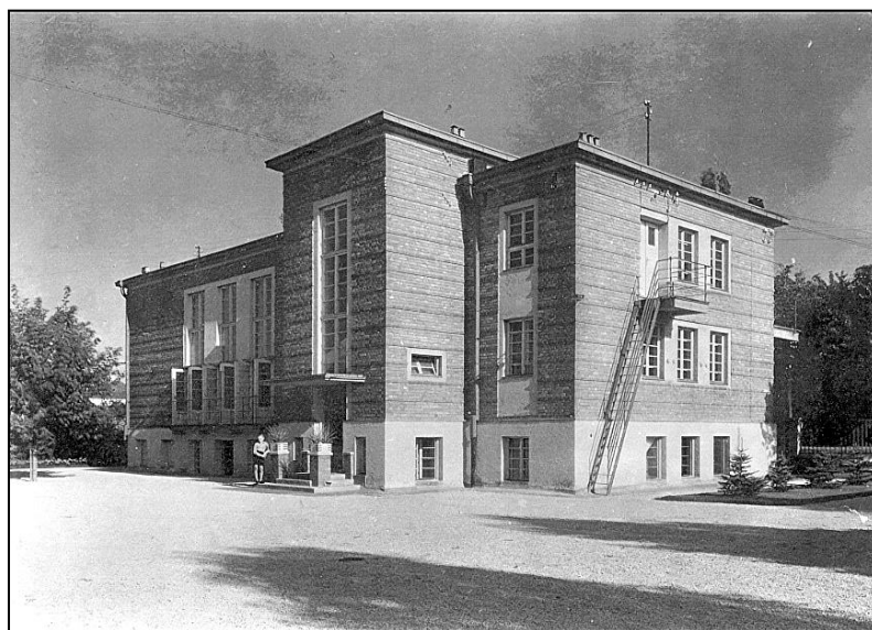
A kultúrház udvari homlokzata 2