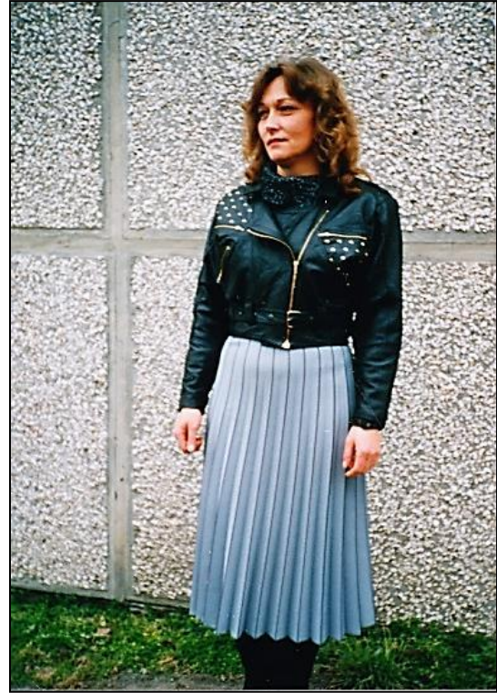
Egyik BNV kiállításon a BSZV termékei