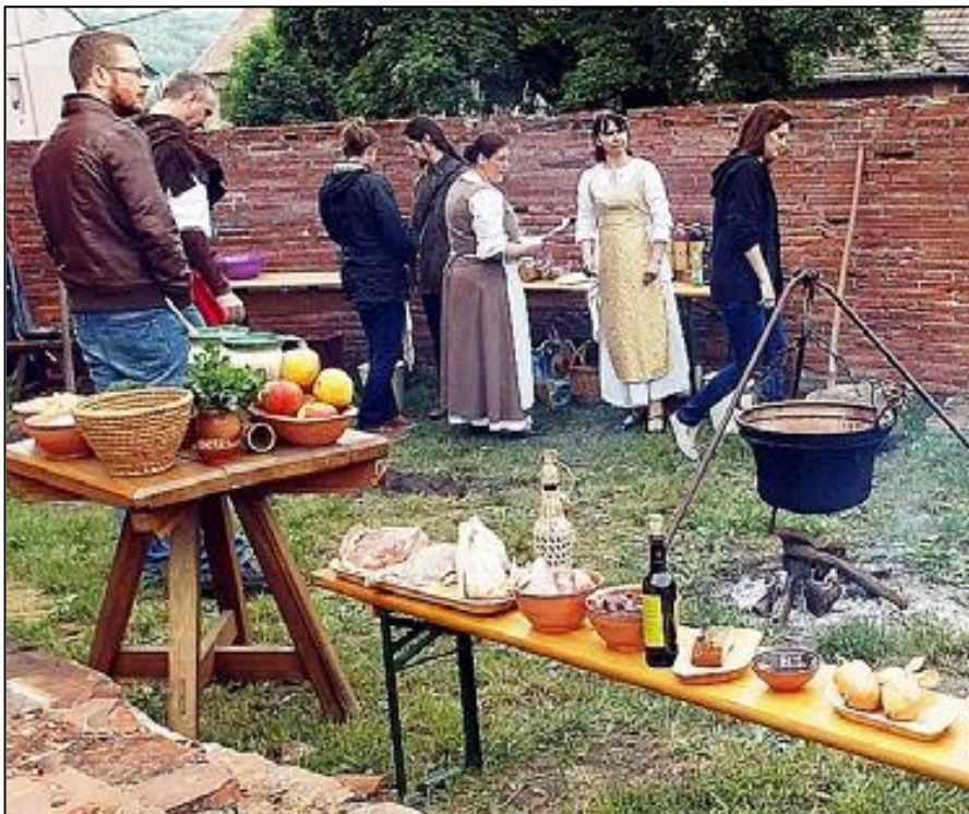
Készülnek a finomnál finomabb középkori étkek. 6