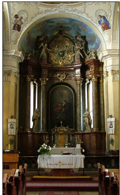
A simontornyai római katolikus templom belső tere. 4