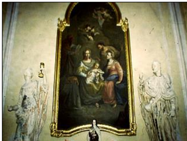
A mennyei Jeruzsálem imádása és a Keresztelő Szt. János születése oltár Szt.Rókus és Szt.Borbála szobrával. 5