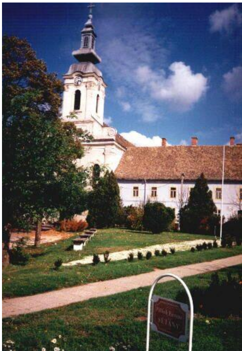
A simontornyai római katolikus templom és a hajdani ferences rendi kolostor az ezredfordulón. 3