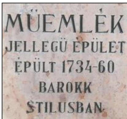
Az épület falán olvasható márványtábla.