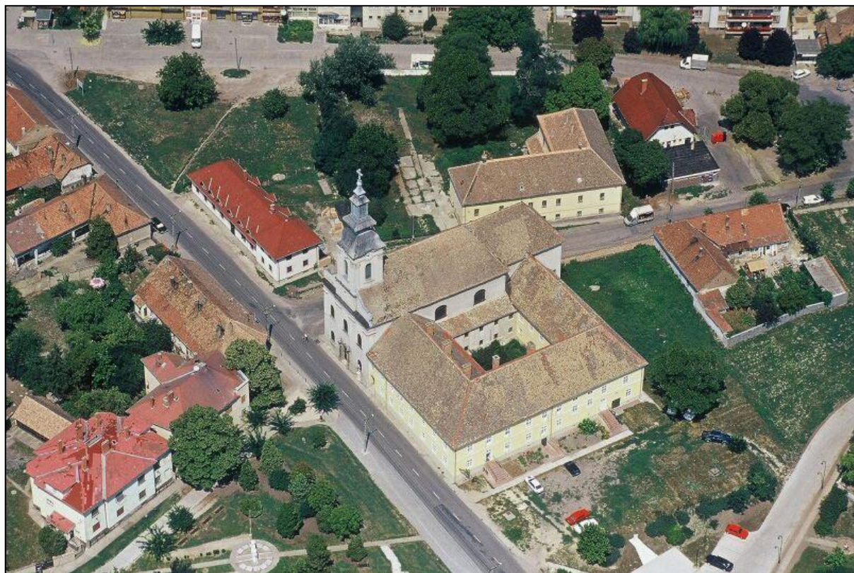
Légi felvétel a római katolikus templomról és a hozzáépített ferences rendi kolostorról. 3