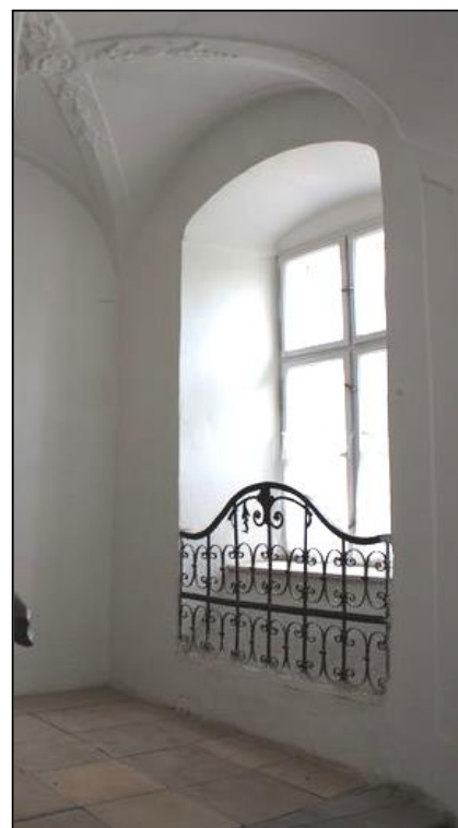
Feljárt a kollégiumba – lépcsőforduló.