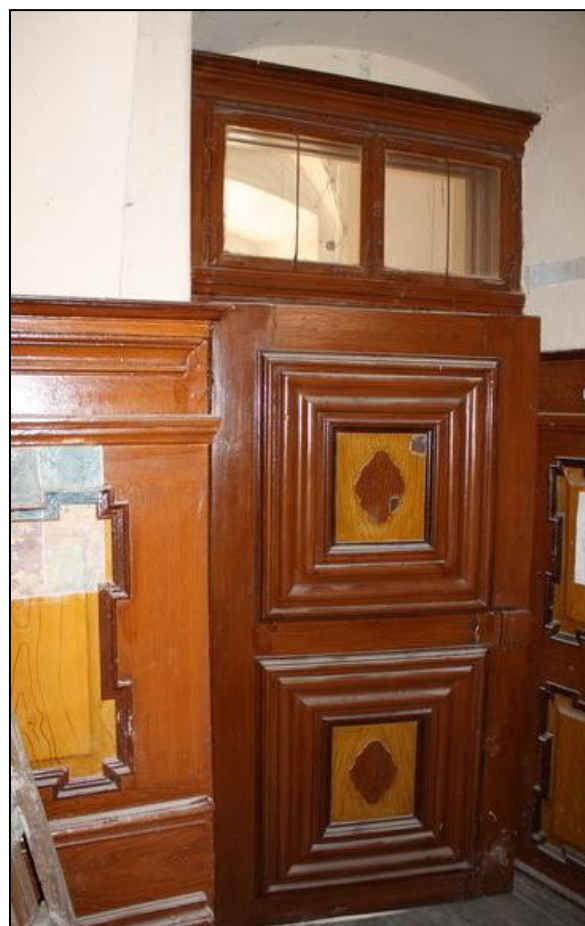
A kolostor 1840-ben beállított cserépkályhája és falburkolata a földszinten, a hajdani ebédlőben. 8