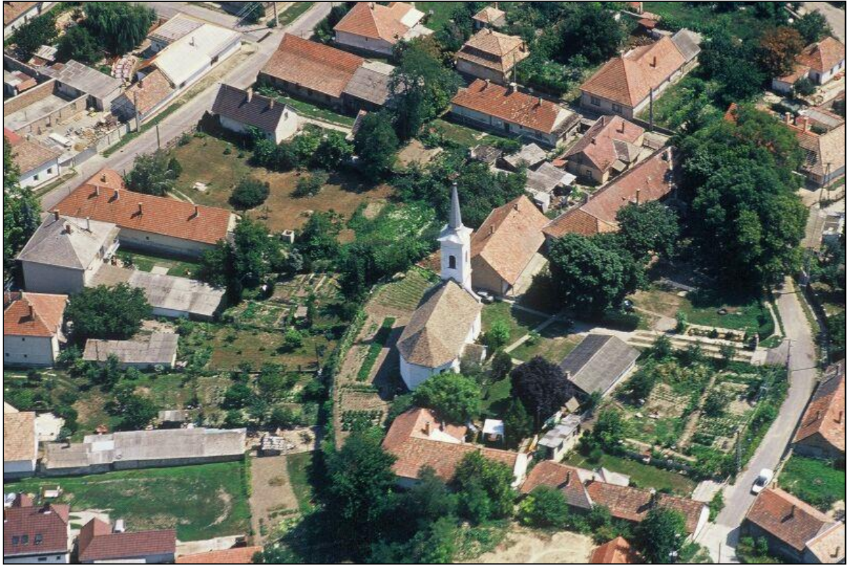
Légi felvétel a simontornyai református templomról és környékéről az ezredfordulón. 3