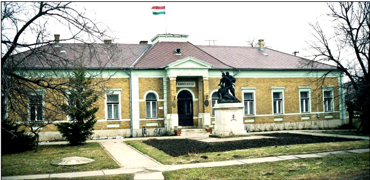
A Városháza és az I. világháborús szobor 1995-ben.

A 2001 óta ismét törvényben rögzített emléknap a Hősök napja minden május utolsó vasárnapján.