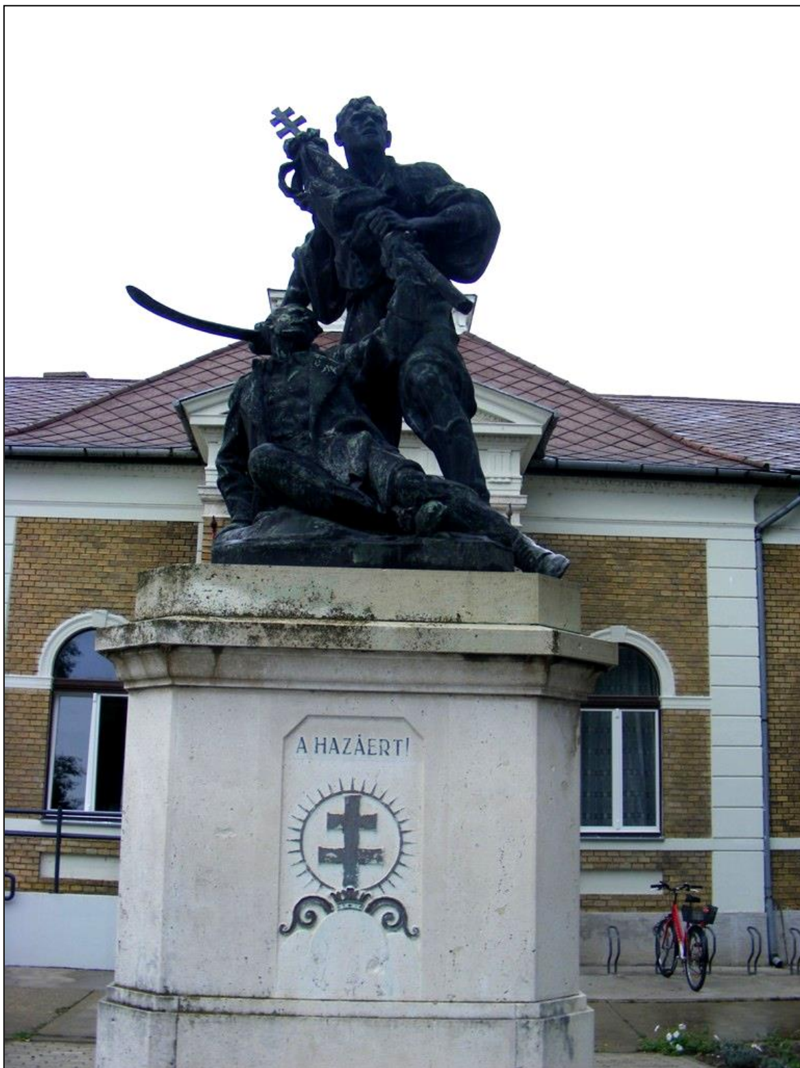
Az I. világháborús emlékmű 2016-ban. 5