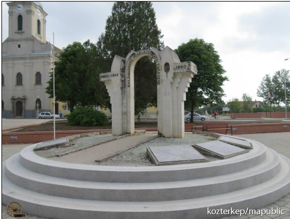
Római katolikus templom és II. világháborús emlékmű Simontornyán 2013 után, a városközpont rehabilitációja utáni időszakban. 3