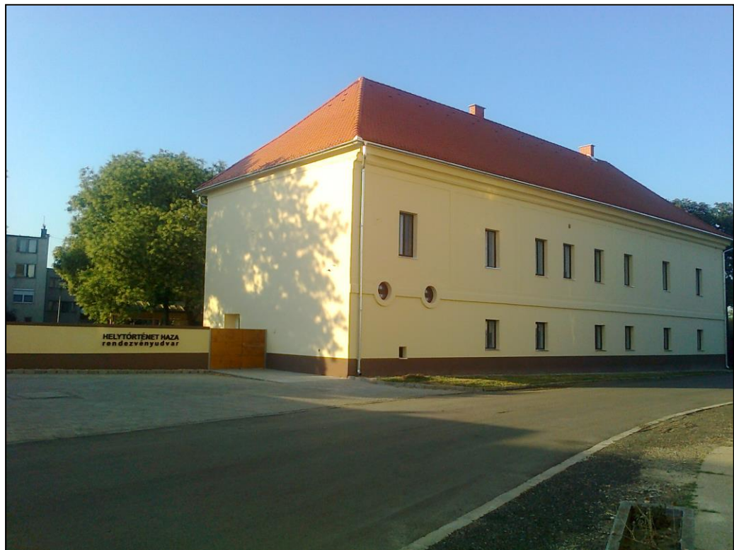
Az épület napjainkban Helytörténet Háza és Hagyatéki Galériaként. 2