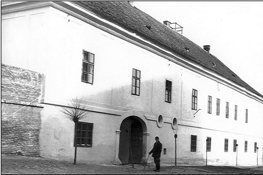
Az 1749-ben felépített Styrum „nagyház” az 1940-es években 1