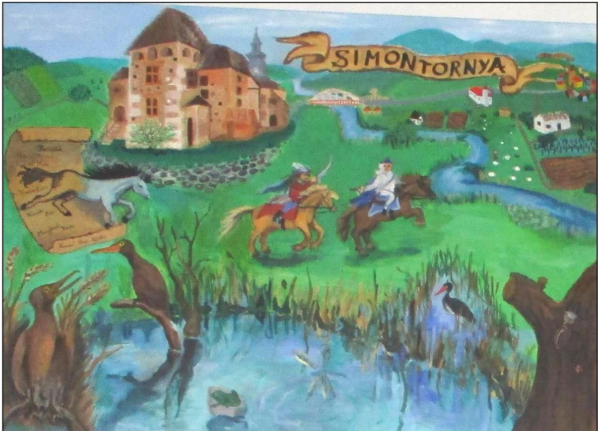
TÁMOP 3.2.3./A-11/1 festő műhely - építő közösség alkotása 2013-ban. 7