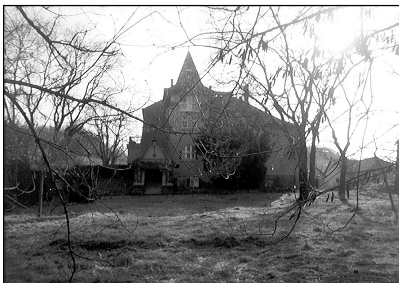
A Villa 1 „Piros villa” korában -a szocializmus idején- a börgyári tisztviselők lakásaként. 5