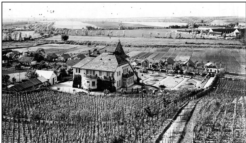
A Villa 1. dél-nyugatról 3