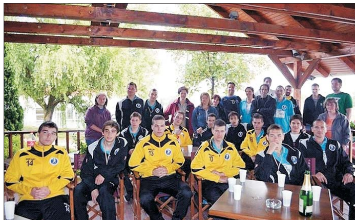
A szurkolók pezsgővel köszöntötték a feljutó csapatot

A szurkolók – zömében szülők – egy meglepetést tartogattak a Duna-Tisza közéről győztesen hazaérkezők számára, a Tulipán étterem előtt hatalmas ovációval, pezsgőfürdővel fogadták kedvenceiket. Szép volt, fiúk!