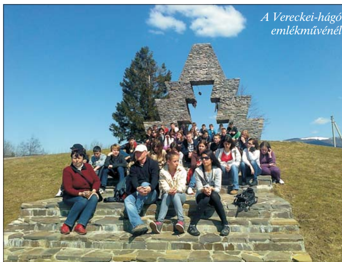
A Vereckei-hágó emlékművénél