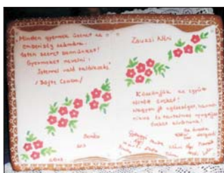
A kollégáktól ezt a tortát kapta