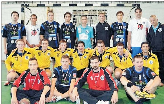
Az NB II-be felkerült csapat