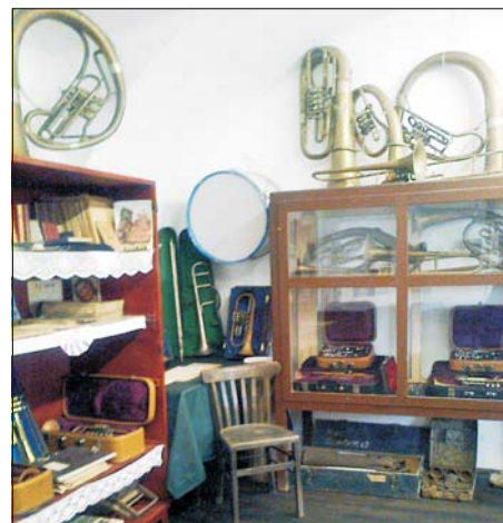
A hajdani bőrgyári fúvós hangszerek

Nagyon köszönöm mindenki segítségét, Simontornya lakóit pedig szeretettel invitálom a Helytörténet Háza kiállításainak