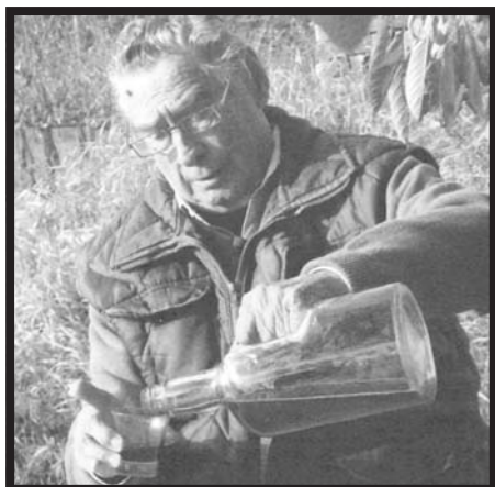
Simontornya, 1932. január 2.– Naarden, 2013. október 8.