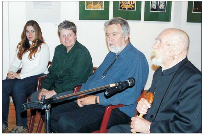
A kiállítás a galéria nyitva tartási idejében látogatható 2013. november 18-ig.

Ez a hármas kapcsolódás mutatkozott be a Tolnai Városi Galéria 2013. október 25-én, 17 órakor nyitó kiállításán. A kiállítást megnyitotta Mözsi Szabó István festőművész, a Magyar Kultúra Lovagja. Közreműködött: ifj. Tövisháti András népzeneész, hangszerkészítő.