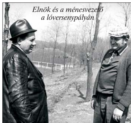
Elnök és a ménesvezető a lóversenypályán

A szövetkezet a felszámolásáig a jó gazdálkodásának köszönhetően szépen gyarapodott. A Balaton parton és Harkányban nyaraló állt rendelkezésre a tagoknak és