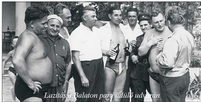
Lazítás a Balaton parti üdülő udvarán