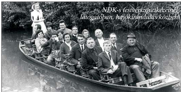
NDK-s festvérszövetkezetnél látogatóban, hajókirándulás közben