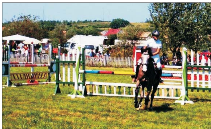
Nagy lóverseny, sok néző