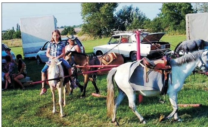
Kis búcsú, kevés érdeklődő