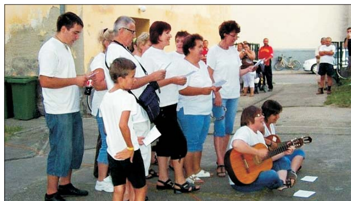
A győztes fehér csapat csasztuskával erősítette meg helyezését

Az augusztus 20-án már hagyományosan megrendezett városi vetélkedő szervezéséhez én is kaptam meghívást. Eldöntöttük, a szokásos három csapatot egy-egy képviselő fogja összefogni. Me-