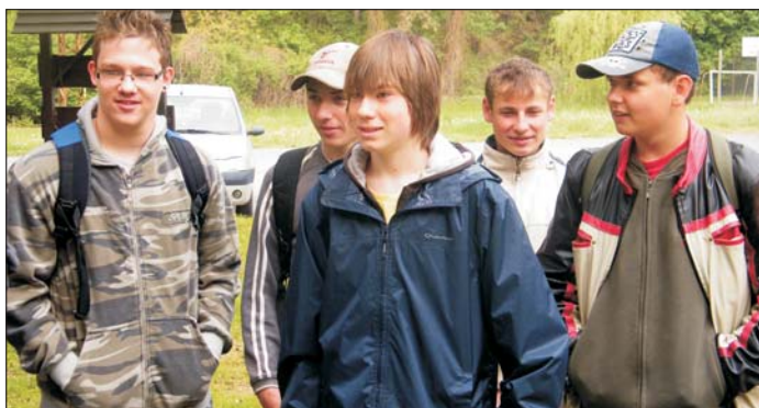
A városkörnyéki verseny győztes csapata