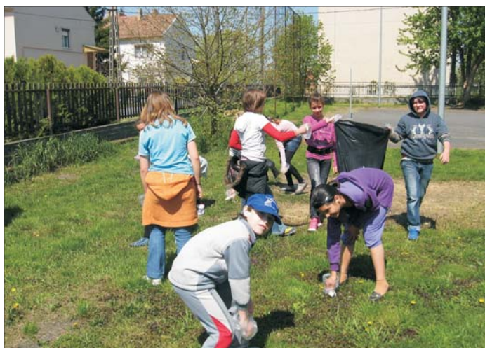
A Föld napján takarítottak a diákok