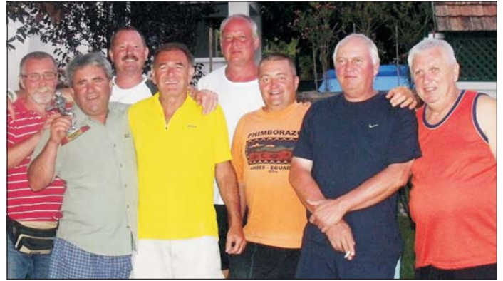
A Simontornyai OPEN teniszkupa győztes csapata