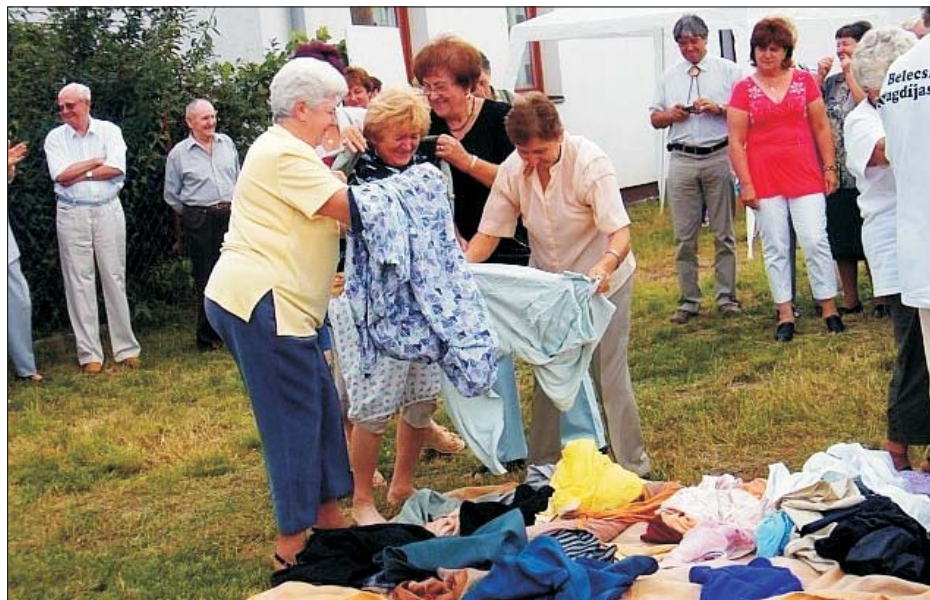
Egy tréfás öltöztetési és vetköztetési feladat a nagykönyi nyugdíjas-találkozóról