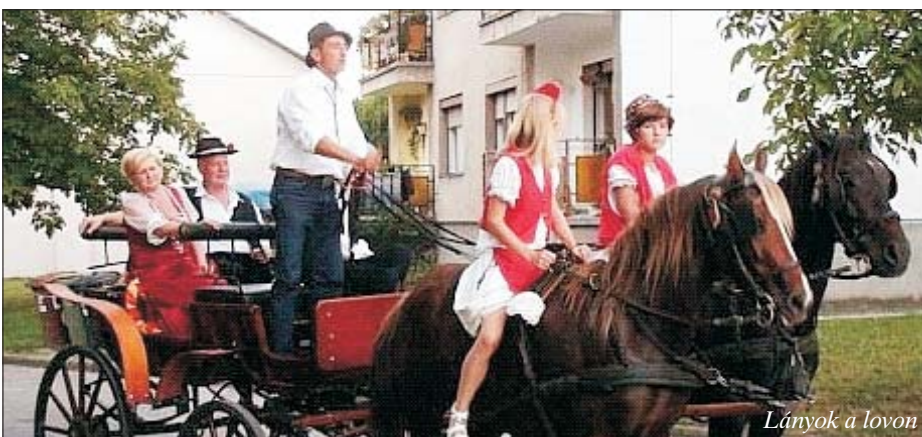
Lányok a lovon

kottak: két díszkaput is építettek, a környék házainak kerítésein szőlők, kukorica-csővek, léggömbök lógtak, a földön pedig díszítők emlékeztettek, hogy a szüret nemcsak a szőlőről szól. Este, bármilyen fáradtak is voltak a felvonulók, a város lakói, a közös vacsora után jól szórakoztak, mulattak, táncoltak. Erre szokták a honvédségnél mondani: a foglalkozás, jelen esetben a szüreti mulatság, elérte célját.