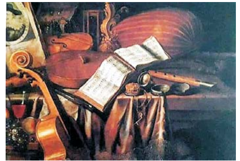
Evert Collier Vanitas: Csendélet

– Szeretek utazni, sajnos a járvány miatt sok tervezett utazásom elmaradt. Jó lenne eljutni azokra a helyekre, ahol eredetiben láthatóak a könyvekből megismert a művészeti alkotások. És szeretem az állato-