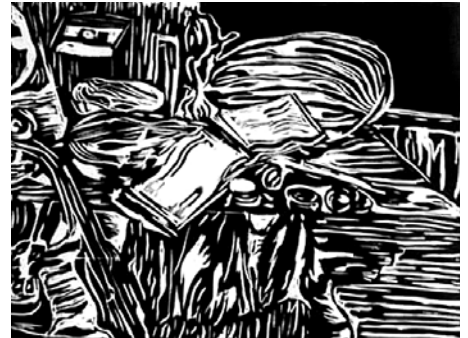
Evert Collier Vanitas című Csendélete alapján készített linómetszet

kat, jelenleg négy cicánk van, róluk gondoskodom, játszom velük.