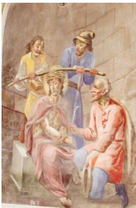
Freskó Jézus szenvedéstörténetéről