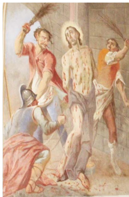
Freskó Jézus szenvedéstörténetéről