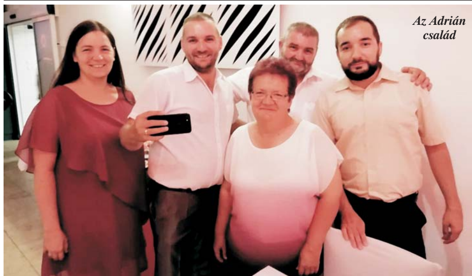
Az Adrián család