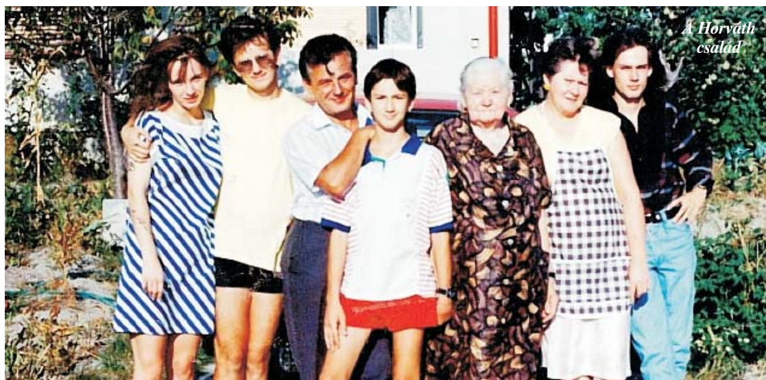
A Horváth család