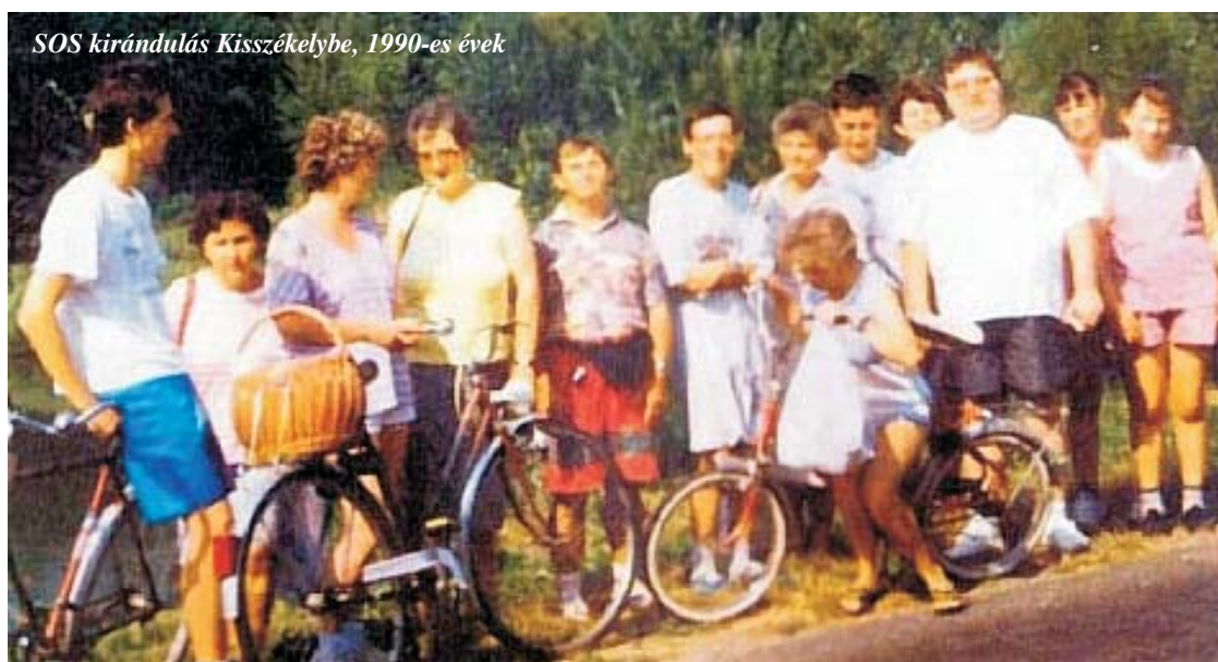
SOS kirándulás Kisszékelybe, 1990-es évek