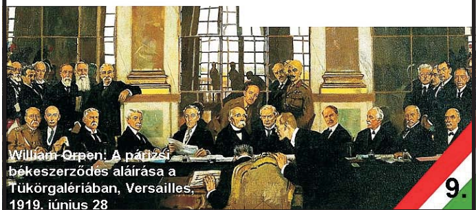
William Orpen: A párizsi békeszerződés aláírása a Tükörgalériában, Versailles, 1919. június 28

lord Newton, a brit Lordok Házának tagja, 1921-ben, a trianoni diktátum angol parlamenti vitájában