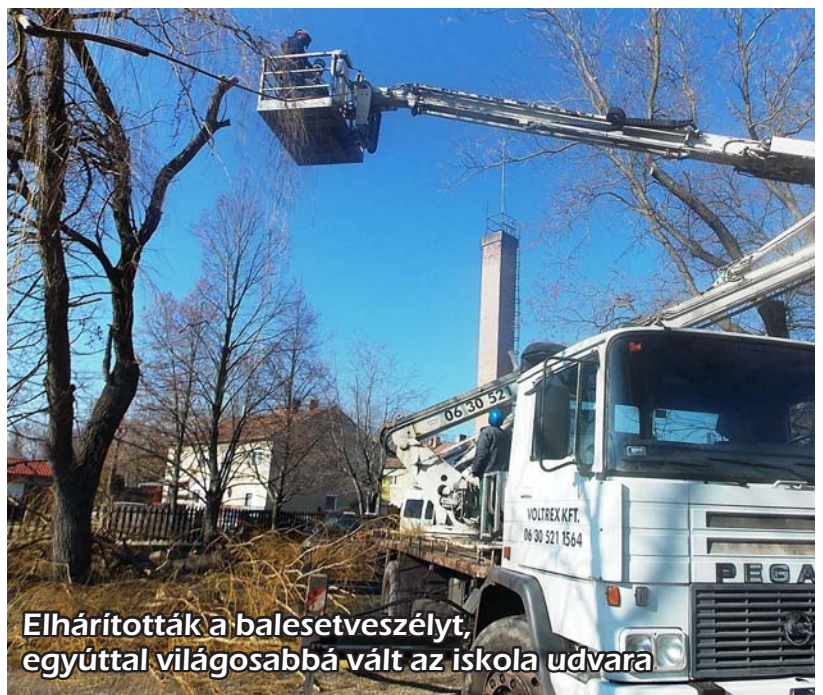
Elhárították a balesetveszélyt, egyúttal világosabbá vált az iskola udvara