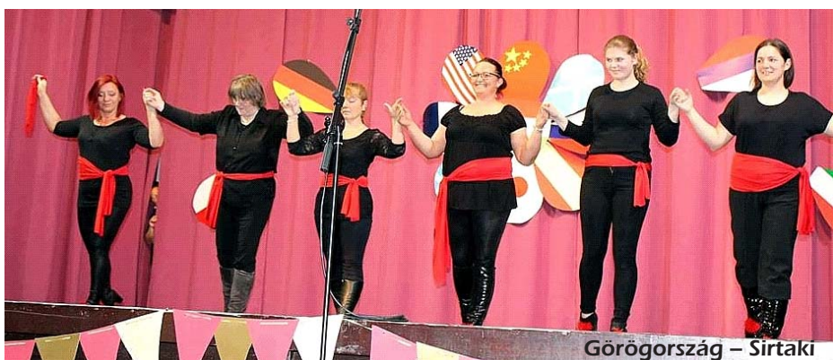
Görögország – Sirtaki