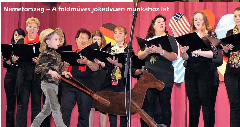
Németország – A földműves jókedvűen munkához lát