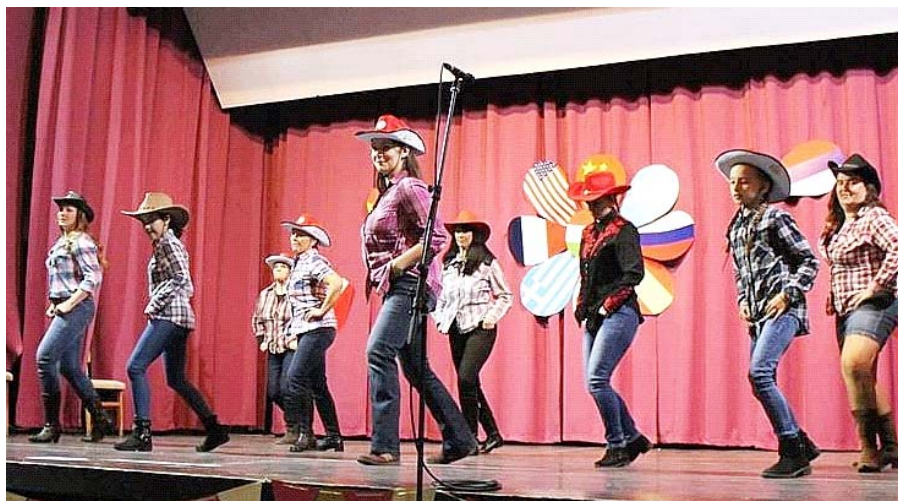
Amerika – country