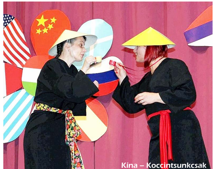
Kína – Koccintsunkcsak