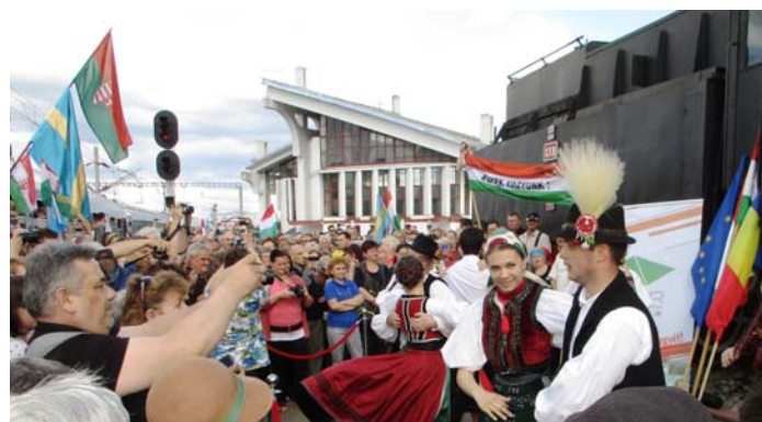
Kolozsváron zenészek és népi táncosok köszöntöttek bennünket

Már az indulás is fantasztikus volt, amikor 1120 zárándokkal, szászámra lengő zászlóval kigördült a vonatunk a Keleti-pályaudvarról. A magyar határnál hazai gyermekek énekeltek, integettek nekünk, a túloldalon, Nagyváradon Tőkés László református püspök, EP képviselő vezetésével köszöntöttek bennünket az erdélyi magyarok. Kolozsváron népi táncosok, zenészek és a magyar, majd székely Himnusz éneklő honfitársaink fátyolos szemmel fogadtak, s bizony mi is minduntalan elérzékenyültünk. Éjjel a 3 órás késés és szakadó eső ellenére is vártak bennünket a szállást adó kis falvak állomásain, hol gyermekdal, hol fúvószekar szólt a tiszteletünkre. Még ki sem tisztult a szemünk, amikor újra könnybe lábadt a hatalmas szeretet láttán. Legmeghatóbb talán az volt számunkra, amikor egy egyedül álló házból egy idős néni futott ki, és megfeszített erővel egy hatalmas nemzetiszínű zászlót lobogtatott nekünk. Önként szakadt fel bennem: Istenem! Menyire várt bennünket!