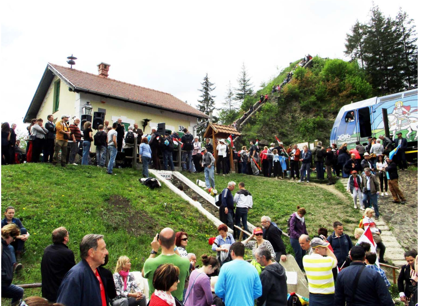
Az ezeréves határnál – a 30. vasúti őrház, alatta a bunker. mellette a hajdani Rákóczi várra felvivő lépcső, jobbszélen a zarándokvonat Szent Márton mozdonya

Katartikus élménnyel indultunk Madéfalvára, ahol meghallgattuk a Böjte Csaba által celebrált misét. Szinte a ferences szerzetes teljes közelében ültünk, s őszinte, egyszerű szavai mély hatással voltak ránk. Később a nagyszínpadon köszönte meg, hogy vonatunk, a Csíksomlyói Expressz és a Székely Gyors utasai 1.240.000 Ft-ot gyűjtöttek össze árvaházai javára.