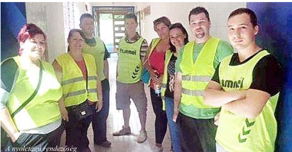
A nyolctagú rendezőség