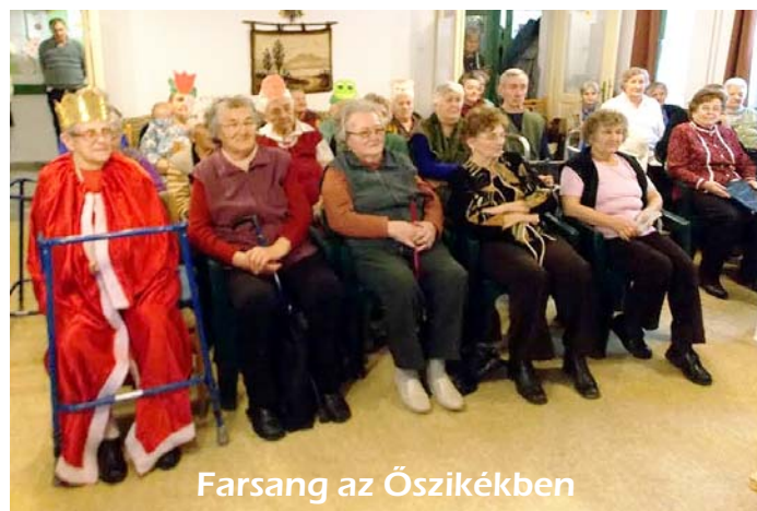
Farsang az Őszikékben