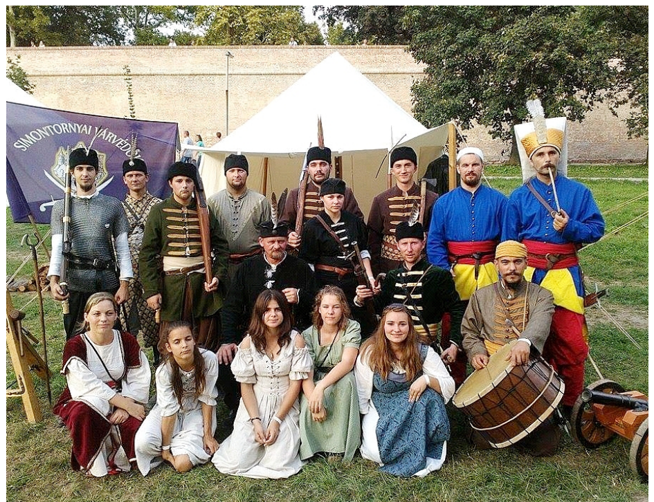
A simontornyai várvédők a szigetvári fesztiválon sem vallottak szégyent