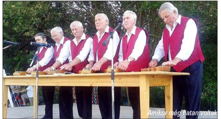
Amikor még hatan voltak