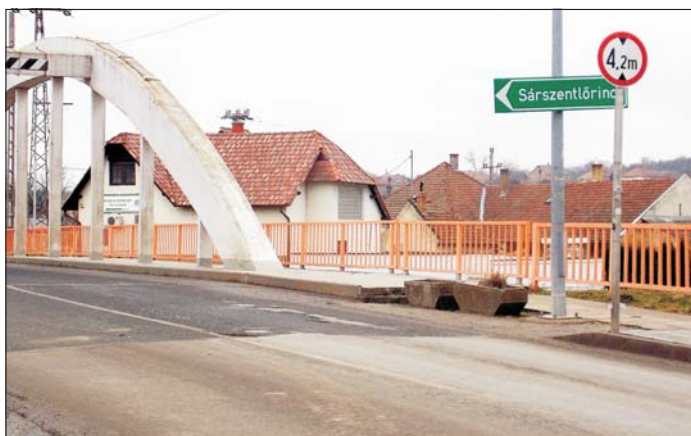
Sárszentlőrinc merre van? Előre egyenesen vagy a Sió-csatornán keresztül, úszva?

Fizessen elő A SIMONTORNYAI HÍREKRE a polgármesteri hivatalban!