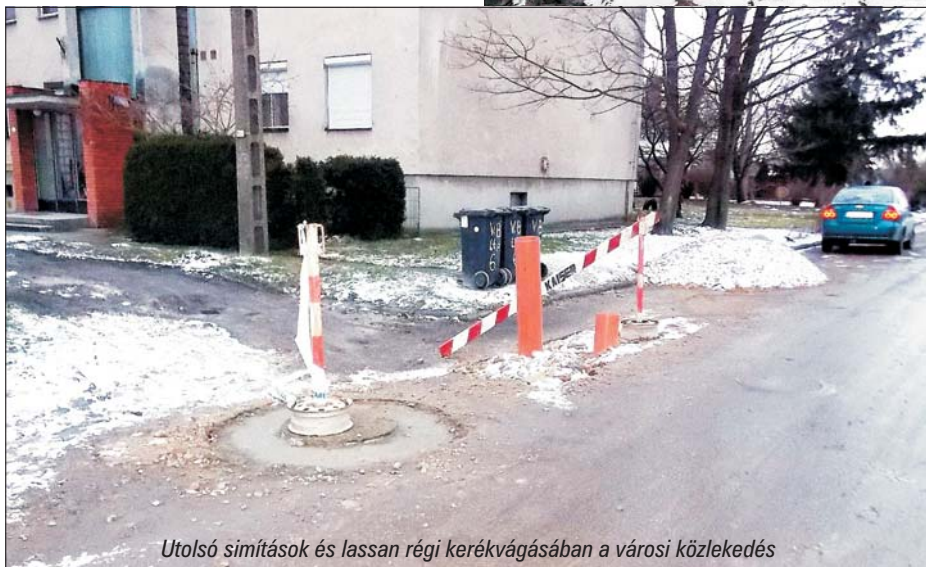
Utolsó simítások és lassan régi kerékvágásában a városi közlekedés