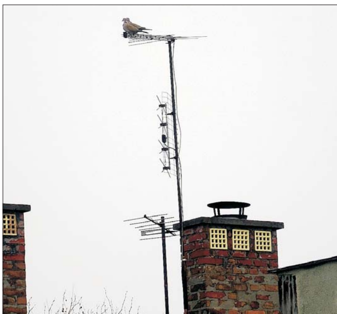
Párosan szép az élet, új funkciót kapott a TV antenna.

Nincs még vége a télnek, ezért továbbra is etessük a madarakat. Főleg a napraforgót kedvelik, mely a tápértéke mellett felmelegíti a hasznos állatkákat, akik egész évben viszonozzák majd a gondoskodást.