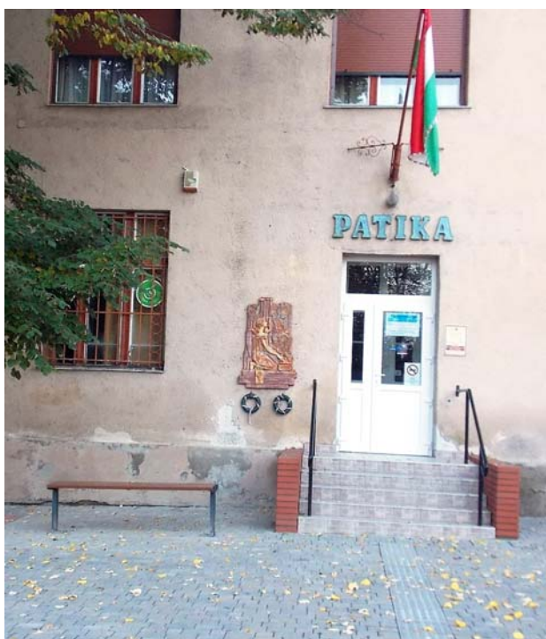
Elkészült a lépcső a patika előtt