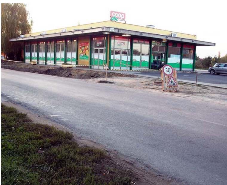
Az ABC előtt parkolót épít az önkormányzat