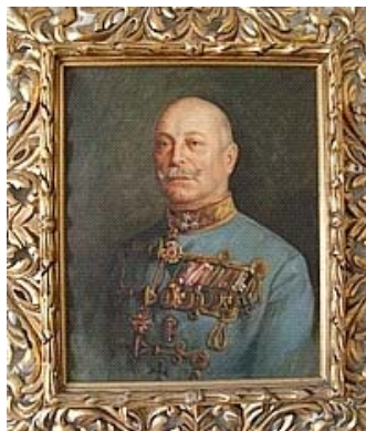
Vitéz Simontornyai Schamschula Rezső tábornok későbbi portréképe I. világháborús kitüntetésekkel

A családról Emlékezés-töredékek c. könyvem mindkét köte-