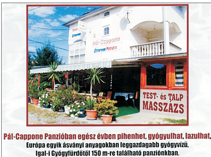
Pál-Cappone Panzióban egész évben pihenhet, gyógyulhat, lazulhat, Európa egyik ásványi anyagokban leggazdagabb gyógyvízű, Igal-I Gyógyfürdőtől 150 m-re található panziókban.