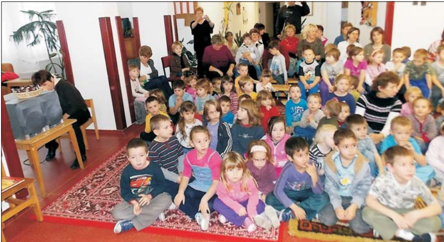
A gyerekek nagy érdeklődéssel figyelték az óvónők karácsonyi előadását