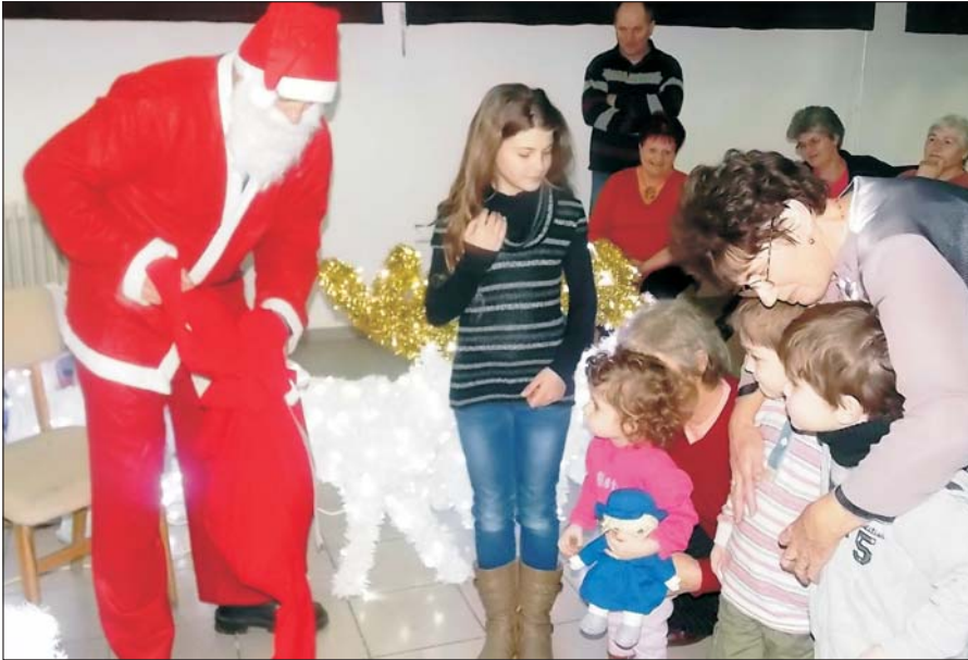
Megünnepelték a karácsonyt a Fény-erő Egyesületben is a gyerekek nagy örömeire