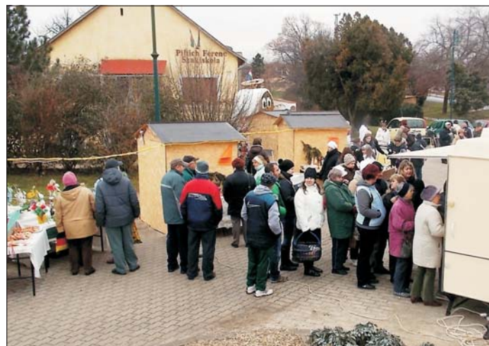
Nagy sikere volt az adventi vásárnak