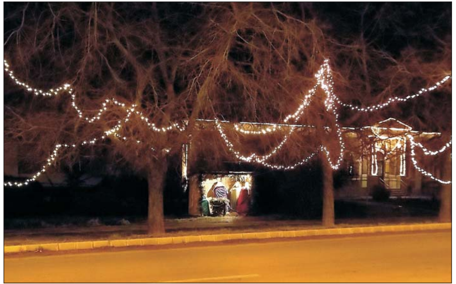
Ismét kigyúltak és ragyogtak a karácsonyi fények. Egyre több utcában helyeztek el karácsonyi füzereket. Este öröm volt sétálni Simontornyán. A polgármesteri hivatal előtt álló hatalmas fenyőfa és a betlehemi jászol jól hangolta a város lakóit a szeretet ünnepére.

Fizessen elő a Simontornyai Hírekre a polgármesteri hivatalban! 200 Ft/újság Egész éves előfizetés: 2400 Ft.