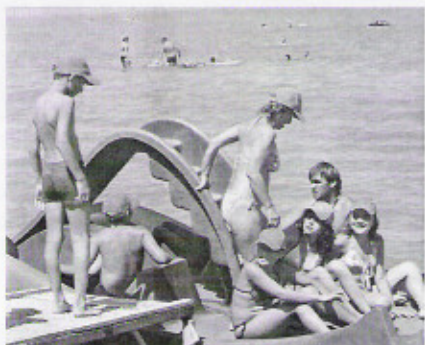
„Jaj, úgy élvezem én a strandot” a Balatonon és Kisszéckelyben.