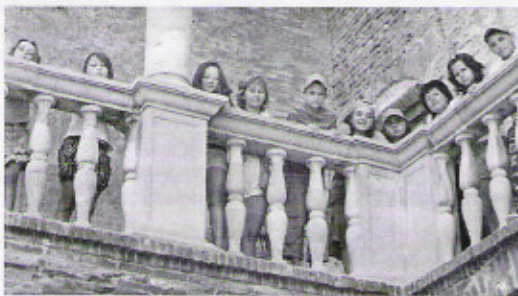
„A simontornyai vár volt a legszebb”