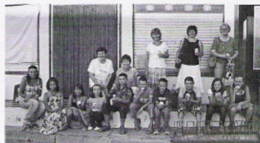
Pihenő a körhintázás után