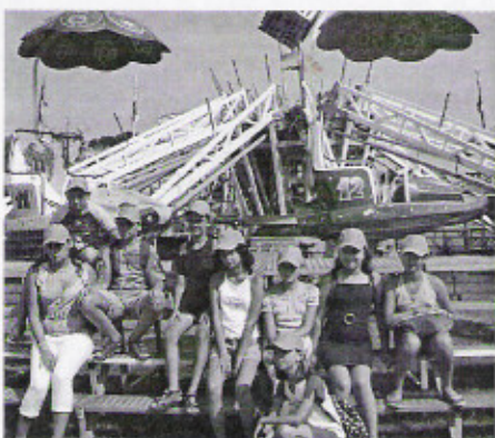
Pihenő a körhintázás után