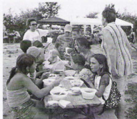
Jól esett a finom ebéd a löversenypályán