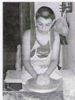
A Simon házban