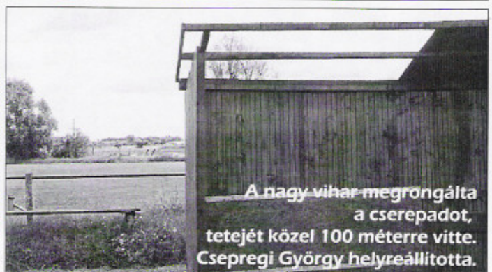
A nagy vihar megrongálta a cserepadot, tetejét közel 100 méterre vitte. Csepregi György helyreállította.