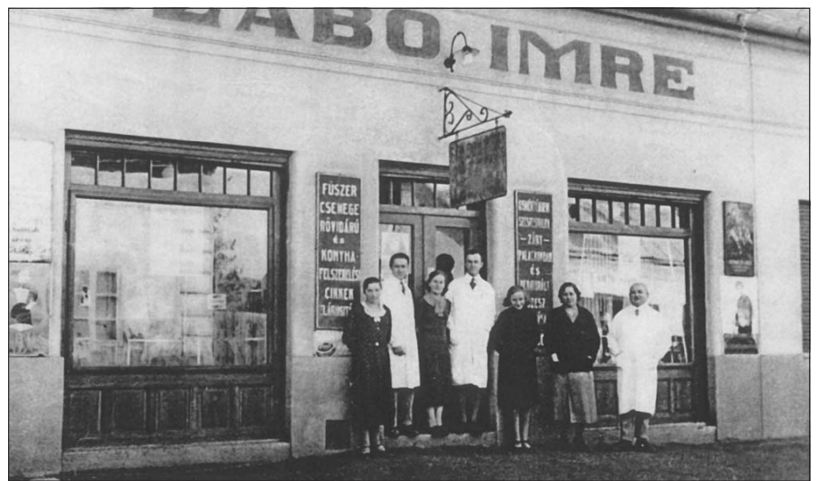
A család és a segédek az üzlet előtt

tartták, s több hónapot börtönben töltött. Csak felesége bátor közbenjárására szabadult, de a tárgyaláson volt katonái is mellette vallottak. Miután hazaengedték, elhelyezkedése hosszú ideig nehéz volt. 1956 októberében a bőrgyár munkástanácsának ő is lelkes tagja volt, mint ahogy mindannyian voltunk, akiket beválasztottak. De az is köztudott volt mindenki előtt, hogy Simontornyán 1956 októberében senkinek nem esett bántódása. Ő maga is inkább csillapította az indulatokat a községben, mégis meghurcolták ismét a forradalmat követően is. Utólag rehabilitálták ugyan, de a történeken ez már nem változtatható.