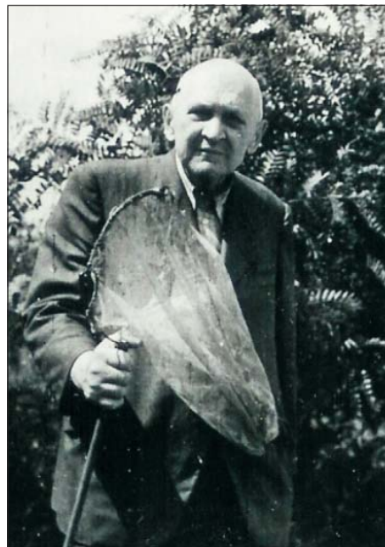
Lepkehálóval az 1930-as évek végén

Rovargyűjteményének szakszerű kezelésére és tárolására kisebb vagyont költött. Külföldön üvegszekrényeket és belevaló nagyméretű üvegfiókokat készíttetett, amelynek nagy része sajnos a gyűjteménnyel együtt megsemmisült a II. világháború barbár pusztítása során, de sajnos volt közöttük lakossági fosztogatás is. Az a kevés, még mindig nagyszámú darab, ami