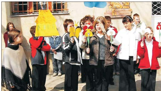
Az emlékező gyermekek